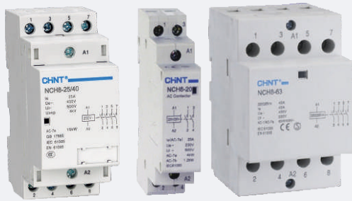
Abb. Schütz 2TE, 1TE, 3TE